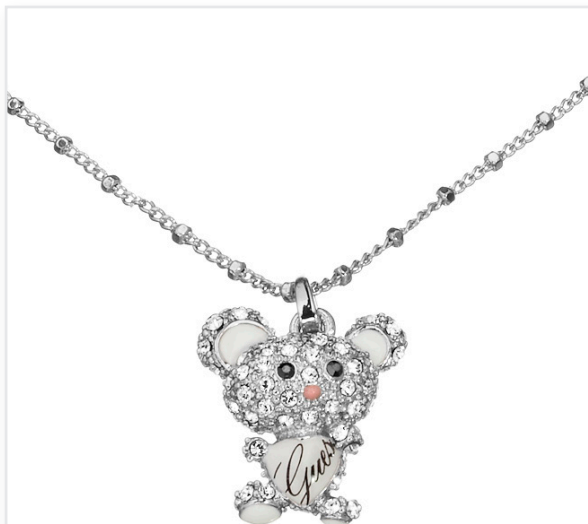
Collier BELLINA l'ourson : 119€