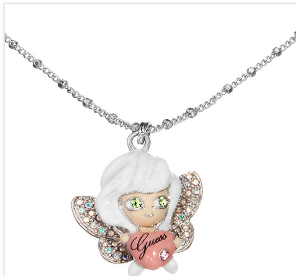
Collier FARRAH la fée : 119€

Fée papillon & baby bear recouverts de strass : une collection de trois colliers pour une allure décalée ou de petite fille sage.