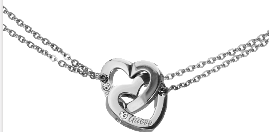
COLLIER COEUR, Acier et diamant : 149€