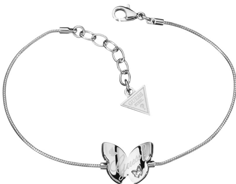
BRACELET PAPILLON, Acier et diamant : 129€