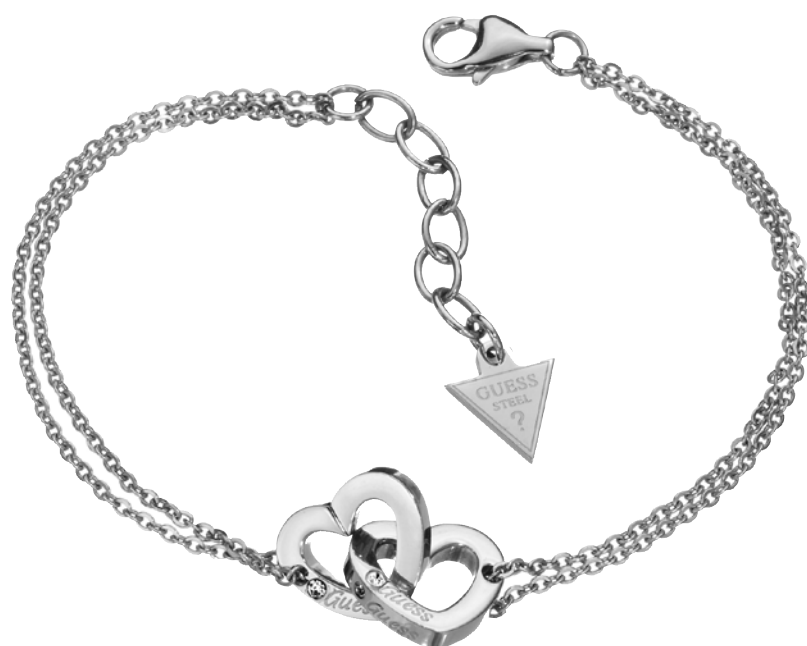
BRACELET COEUR, Acier et diamant : 129€