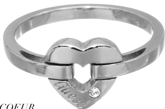
BAGUE COEUR, Acier et diamant : 95€

Duo de cœurs ou papillon stylisé, pour la FÊTE DES MÈRES , GUESS Bijoux présente sa nouvelle collection «Steel Diamond». Nouveauté pour ce printemps : chaque bijou est sublimé d'un diamant.