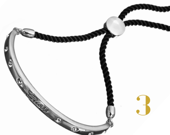
Jonc en métal argenté + strass sur cordon noir 59 €