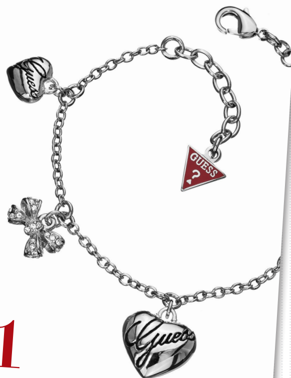
Bracelet en métal argenté + pendentifs cœurs et nœuds strassés 85 €