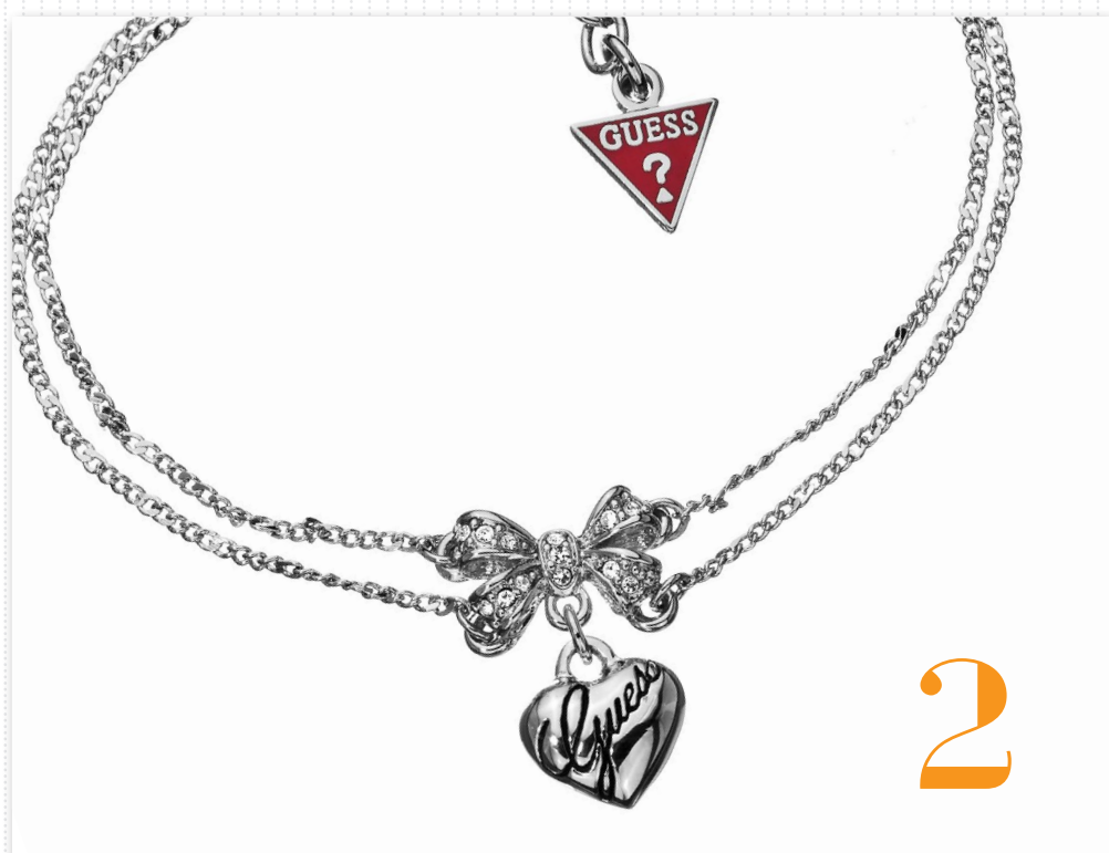
Bracelet double rangs en métal argenté + pendentifs cœur et nœud strassé 45 €

Idées cadeaux ou accessoires de fêtes pour briller le soir de la St Sylvestre, GUESS Bijoux vous donne 5 idées à petits prix !