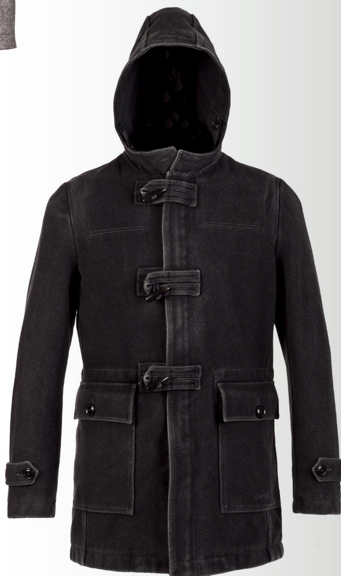
MANTEAU style « duffle coat » en drap de laine used, 499 €