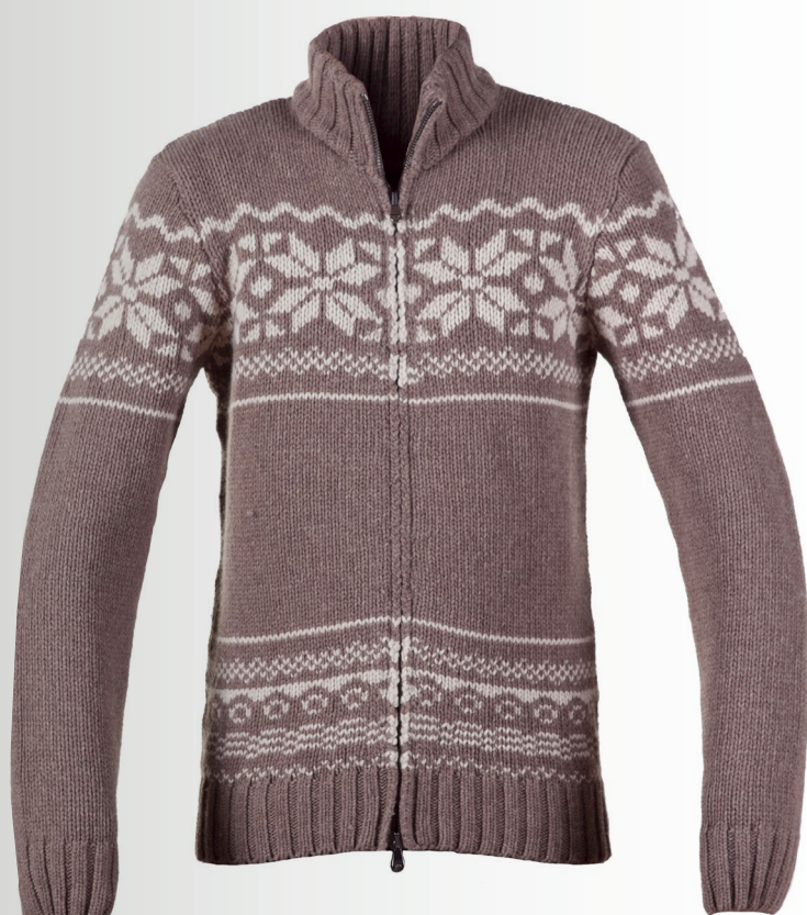
CARDIGAN en laine imprimé jacquard, 189 €