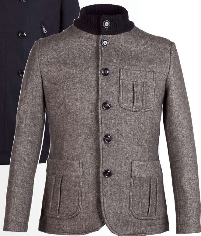
VESTE EN TWEED col en laine, 399 €