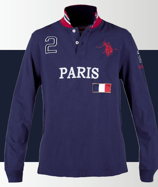
POLOS manches longues en coton, LONDON, NEW YORK, MOSCOW, PARIS, 115€