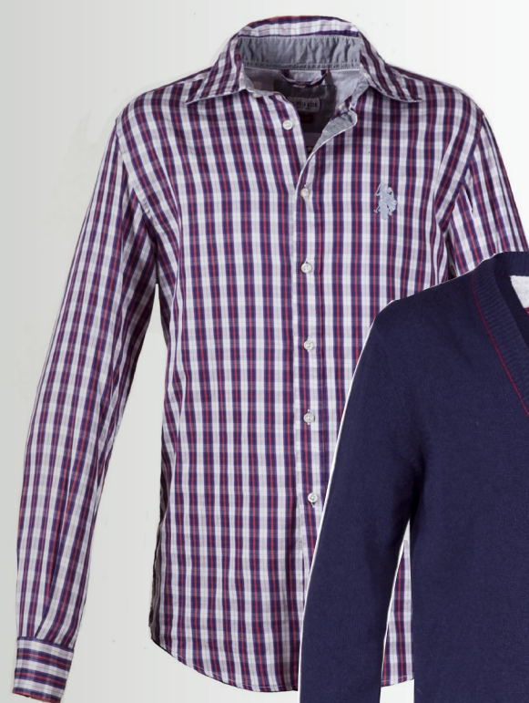
CARDIGAN « preppy » en laine et coton, 185€