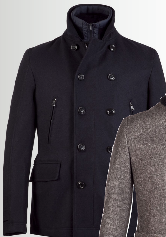
VESTE en laine style « caban », 399 €