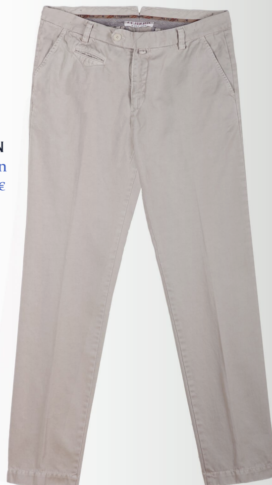
PANTALON « chino » en coton, 139 €