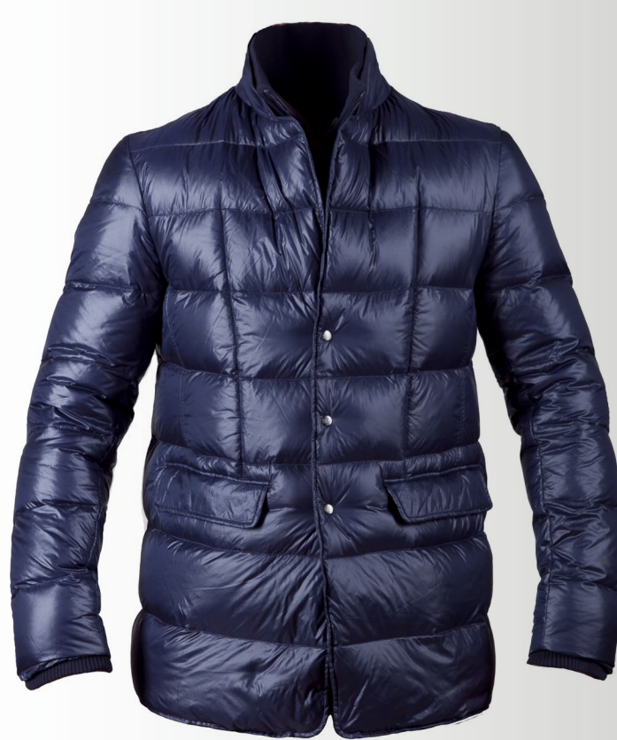
DOUDOUNE en polyamide, 339€